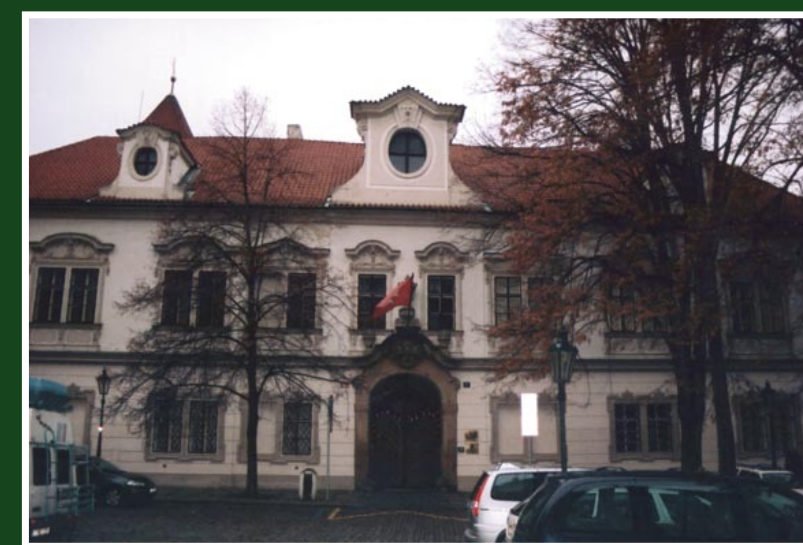
Velkopřevorský palác řádu maltézských rytířů. Pochází z let 1726-28. Postaven byl architektem Bartolomějem Scottim. Průčelí paláce má výzdobu z díly Matyáše Brauna.