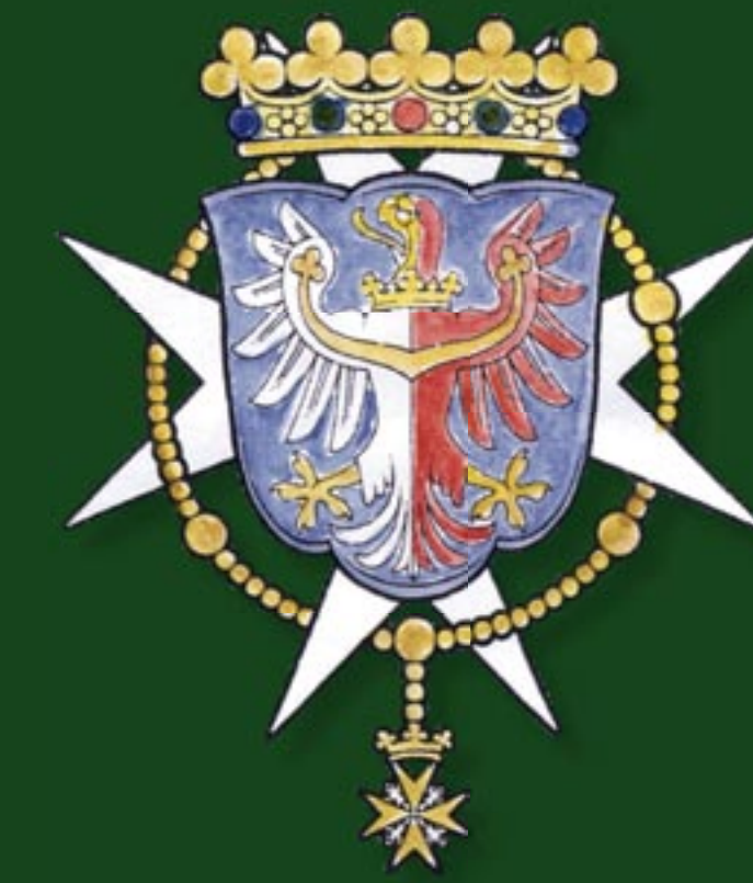
Znak Emanuela Václava Kolovrata jako velkopřevora maltézských rytířů