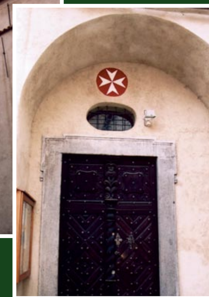
Vchod do řádového kostela sv. Prokopa v areálu strakonického hradu