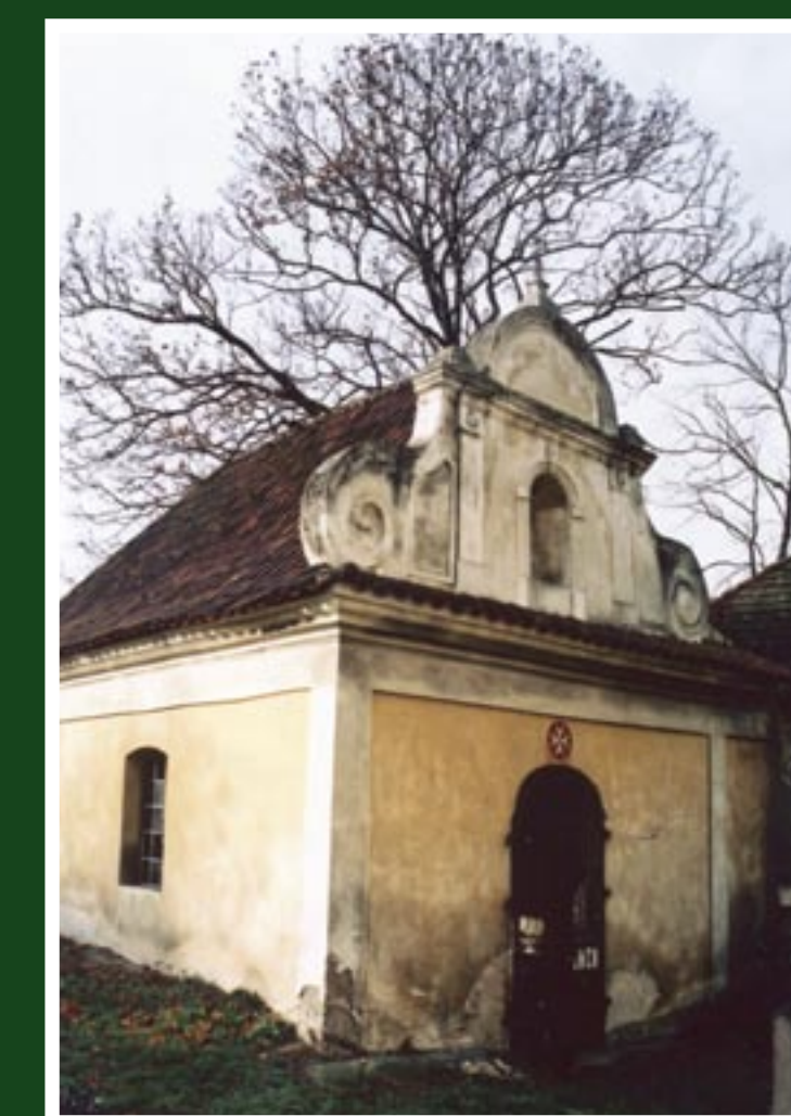
Kaple řádu maltézských rytířů ve Strakoněcích v těsné blízkosti hřbitovního kostela sv. Václava.