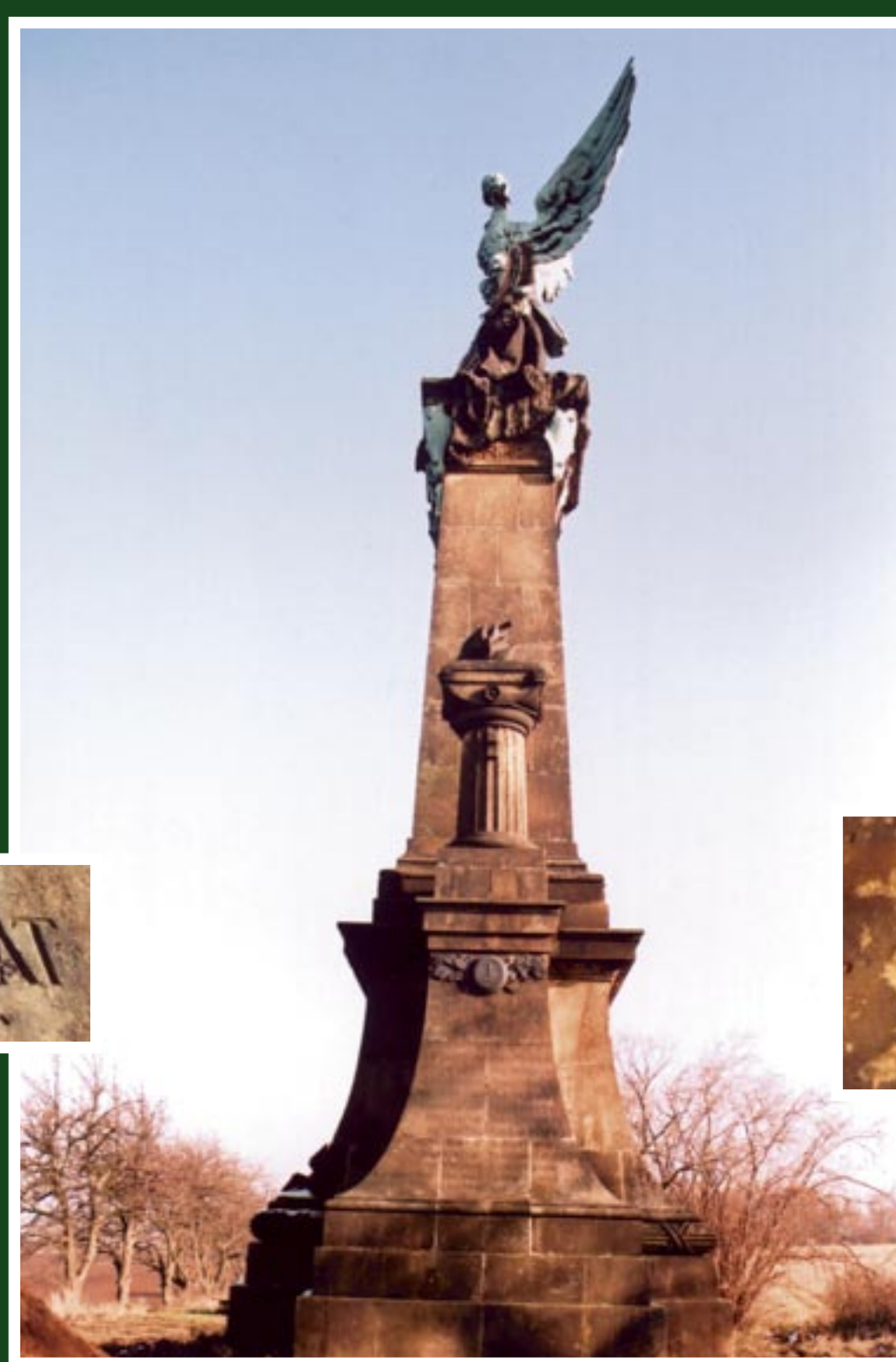
Novoklasicistní pomník z hořického pískovce připomíná vítězství císařsko-královských vojsk v bitvě u Kolína ze dne 18. června 1757. Postaven podle návrhu architekta Václava Weinzettla sochařem Mořicem Černilem z kamenosochařské školy v Hořicích v Podkrkonoší, nákladem 30 000 zl. Slavnostně odhalen a vysvěcen v sobotu 27. května 1899.

Po smrti velkopřevora Václava Jáchyma Čejky z Olbramovic se stává dne 3. října 1754 Frá (bratr) Emanuel Kajetán Václav Kolovrat Krakovský šedesátým šestým českým velkopřevorem řádu maltézských rytířů. Stal se též vyslancem řádu u dvora ve Vídni. Ve stejné době je již proslulým velitelem císařského jezdecktva s hodností generála. Od roku 1753 až do své smrti vlastní dragounský pluk nesoucí jeho jméno. Po bitvě u Kolína je velkopřevor vyznamenan čtyřmi řády a hodnostmi. Je mu udělen titul císařského tajného rady a komořího, velkokříž maltéského řádu. Mezi jinými je to velkokříž nejvyššího portugalského řádu Kristova. Po skončení sedmileté války žil velkopřevor nejraději v řádové rezidenci na hradě ve Strakoněcích. Čas od času zajížděl do Prahy, kde sídlil ve velkopřevorském paláci. Zde je také na čestném místě nad vstupním schodištěm umístěn jeho rodový znak. Znovu se však vrátil a s potěšením prodělal ve svých oblíbených Strakoněcích.