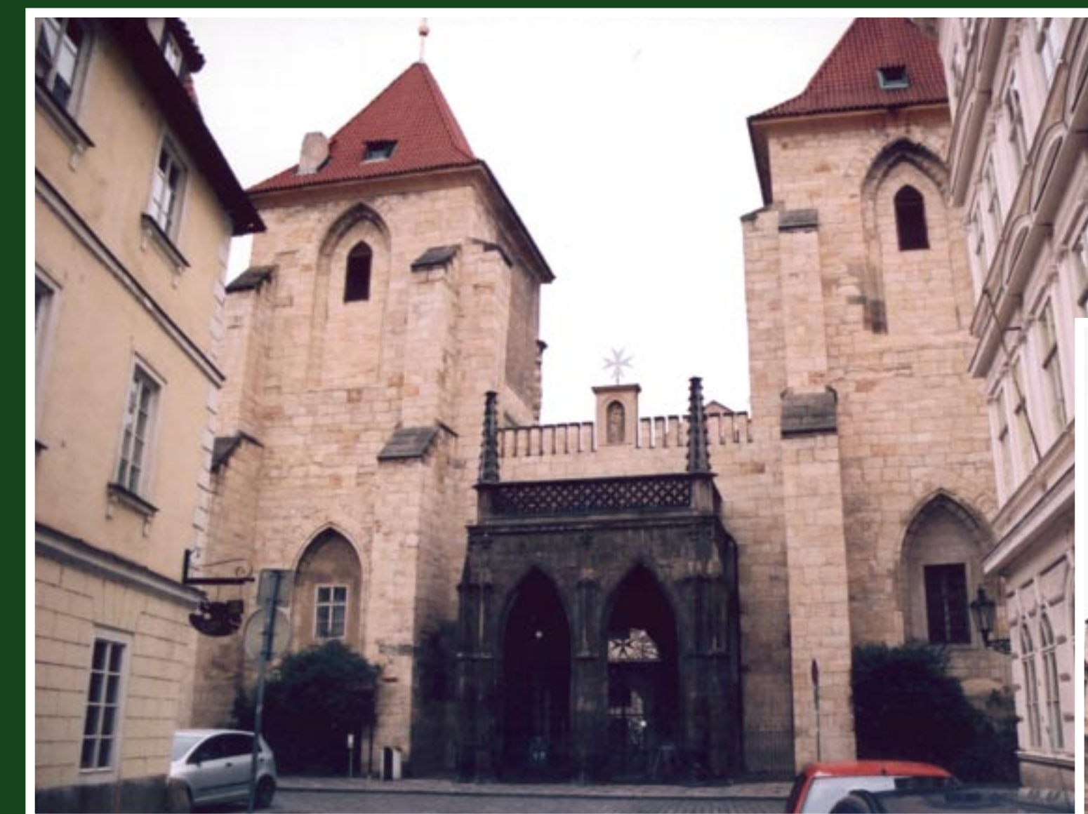
Kostel Panny Marie pod řetězem, zajímavý název „pod řetězem“ byl kostelu dán podle řetězu, kterým se ve středověku uzavírala klášterní fortna

Nachází se na Maltézském náměstí na Malé Straně v Praze. Byl založen společně s komendou (klášterem) johanitů, pozdějších maltézských rytířů, v roce 1169 kancléřem Gervasiem a králem Vladislavem I. jako první instituce tohoto rytířského řádu v Čechách. Podle polohy na konci mostu se i kostel až do 17. století nazýval Panny Marie konce mostu.