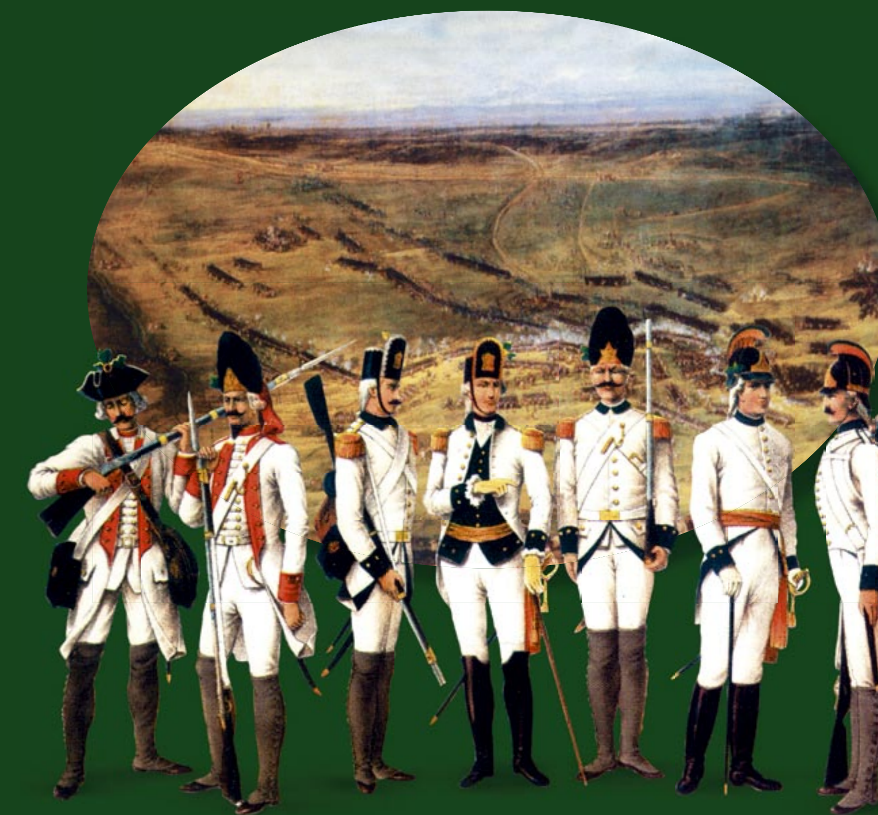
Vývoj uniform pěšího pluku maršála Leopolda Dauna v průběhu 18. století