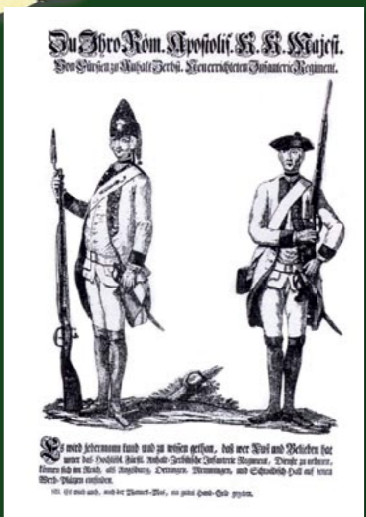
Tištěný verbířský patent. Marie Terezie